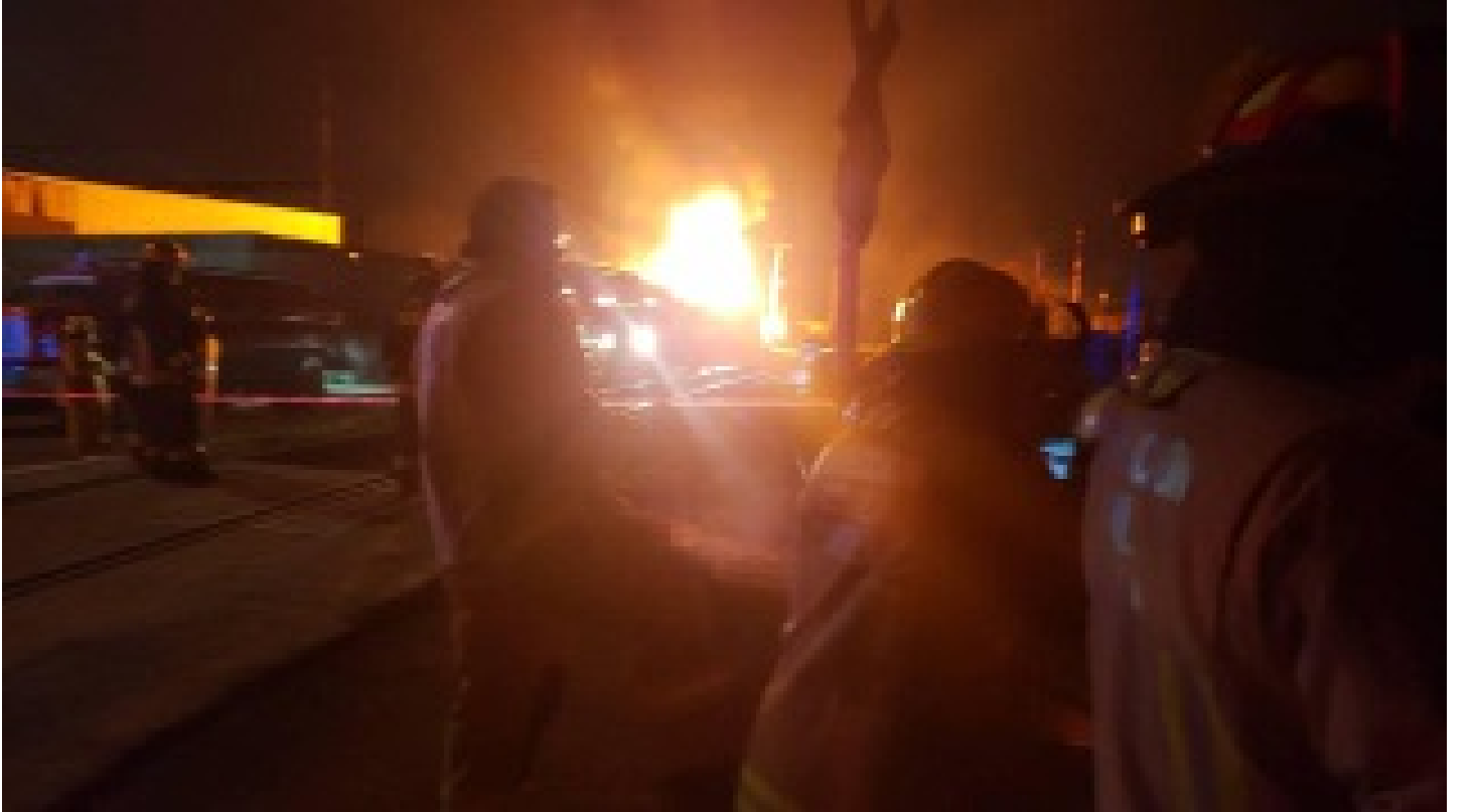
Dolmabahe Sarayı'nda yangın!