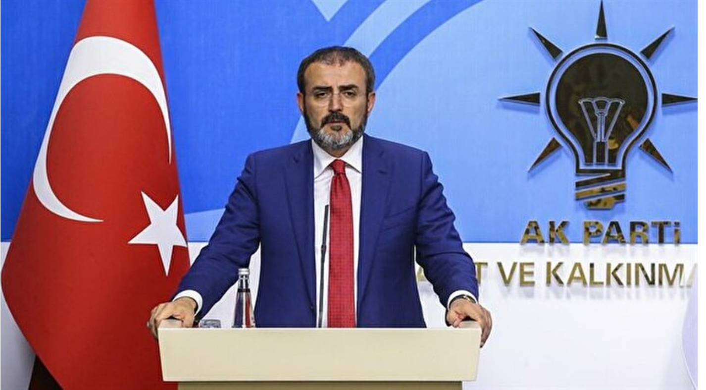
AK Parti Sözcüsü Mahir Ünal

Haber Merkezi · 29 Aralık 2017, 18:09 · Son Güncelleme: 29 Aralık 2017, 20:56 · Yeni Şafak