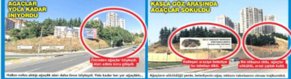
AGAÇLAR YOLA KADAR İNİYORDU