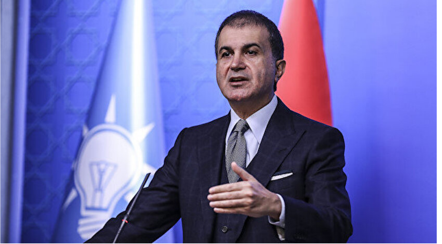
AK Parti Sözcüsü Ömer Çelik

Haber Merkezi · 08 Haziran 2020, 17:08 · Son Güncelleme: 08 Haziran 2020, 18:03 · AA, Yeni Şafak