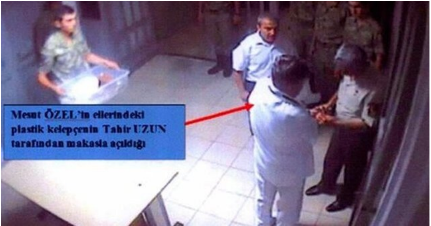
Deniz Harp Okulu Komutanı Tümamiral Mesut Özel'in alıkonulmasına ilişkin kamera kayıtları.

Semin Barbaros Ustun ve eski ustegmenler İbrahim Halil Tekatlı ile İsa Demirdürek 1 Cebir ve şiddet kullanarak anayasal düzeni ortadan kaldırmaya teşebbüs" suçundan ağırlaştırılmış müebbet cezasına mahkum etti.