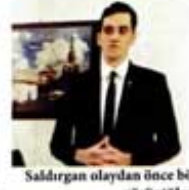
Saldırgan olaydan önce böyle görüntüldü.

MİLLETVEKİLLERİ, BAŞKANLIĞI GETİREREK MECLİS'İ DEVRE DIŞI BIRAKMAYI AMAÇLAYAN TEKLİFİ GÖRÜŞECEK