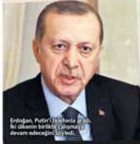
Erdoğan, Putin'i telefonla aradı. Hiç konuşmadı. (Zaman) 22 Temmuz'da devam edeceği bildirildi.