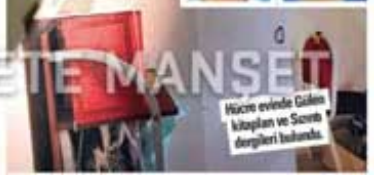
Hücre evinde Gülen kitapları ve Suurb dergileri bulundu.