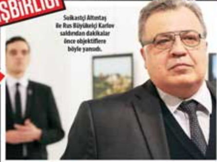
Suikastçı Altıntaş ile Rus Büyükelçi Karlov saldırıdan dakikalar önce objektiflere böyle yanadı.

ABD'nin tetikçisi FETÖ, Türk-Rus ilişkilerini baltalamak için alçak bir saldırı daha gerçekleştirdi. Rusya'nın Ankara Büyükelçisi Andrey Karlov, Moskova'daki tarihi Halep Zirvesi'nden bir gün önce Ankara'da uğradığı suikast sonucu katledildi.