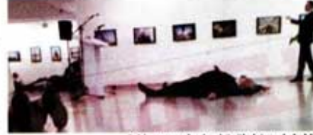
Saldırının ardından büyükelçi yerde kaldı.

sergi salonunda çatışma başladı. Polis olduğunu söyleyerek içeriği girdiği söylenen saldırganın, Halep'in intikamını almak için bu saldırıyı düzenlediği ve olay sırasında Türkçe "İşte sizi böyle öldürürüz. Siz de güvende değilsiniz" dedi. Saldırganın ardından açıklama yapan Rusya Devlet Başkanı Putin, "Hesap soracağız" dedi. 57