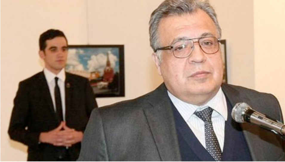
İddianamede Karlov'un eşi

Şüpheliler hakkında "anayasal düzeni ihlal", "silahlı terör örgütüne üye olma", "terör amaçlı tasarlayarak öldürme", "terör amaçlı kasten öldürmeye teşebbüs" ve "terör amaçlı korku, kaygı veya panik yaratabilecek tarzda silahla ateş etme" suçlarından ağırlaştırılmış müebbet ve çeşitli hapis cezaları istendi.