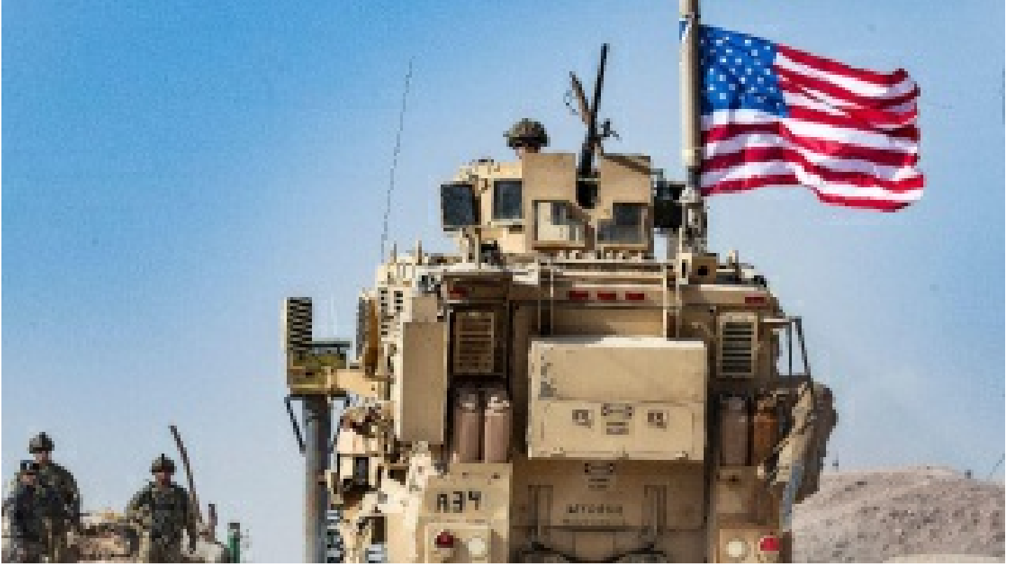
Suriye'de ordu ve halk el ele verdi, ABD'yi kovdu!