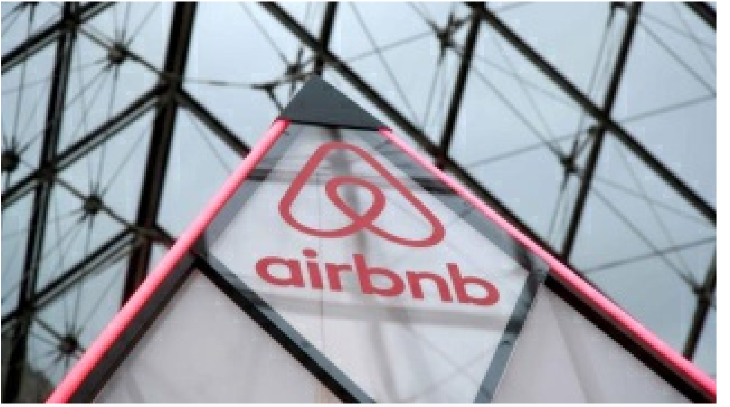
Airbnb Rusya ve Belarus'ta faaliyetlerini durdurdu