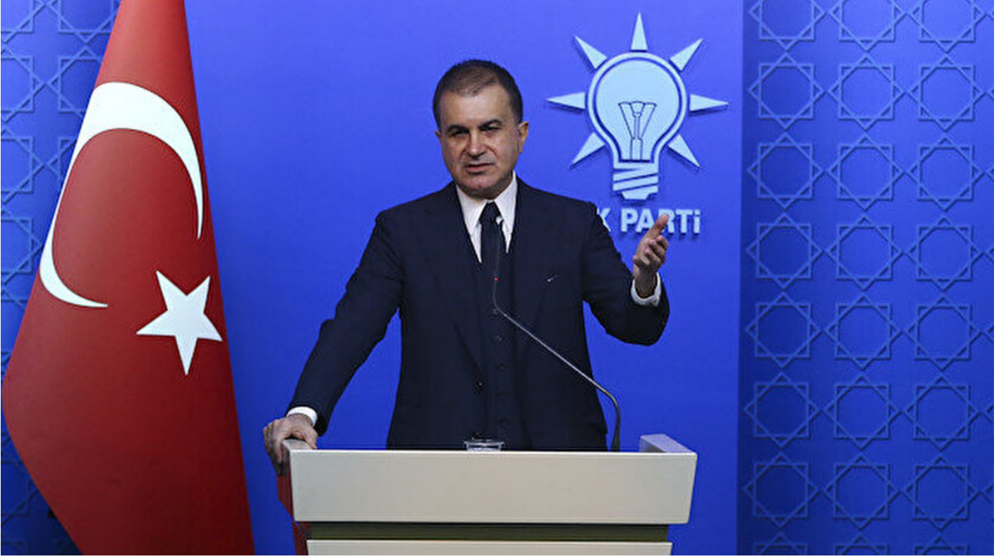
AK Parti Sözcüsü Ömer Çelik