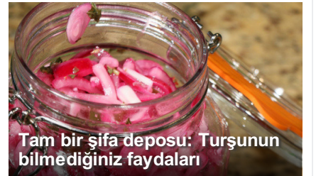
Tam bir şifa deposu: Turşunun bilmediğiniz faydaları