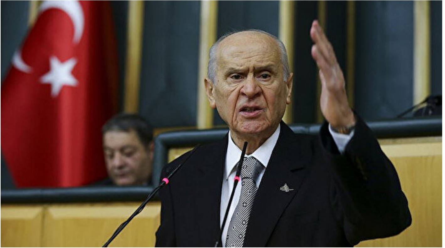
MHP Genel Başkanı Devlet Bahçeli