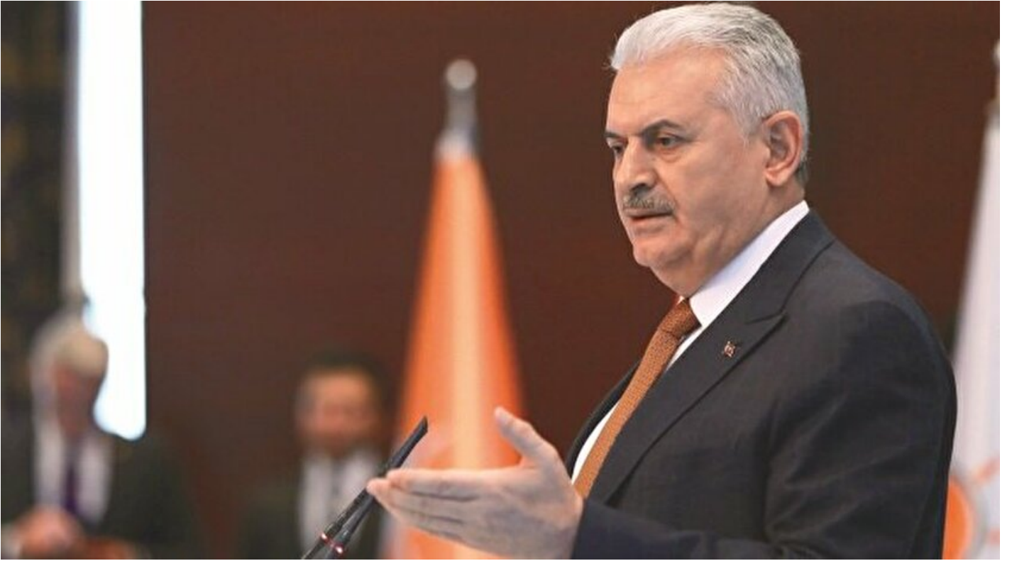
Başbakan Binali Yıldırım