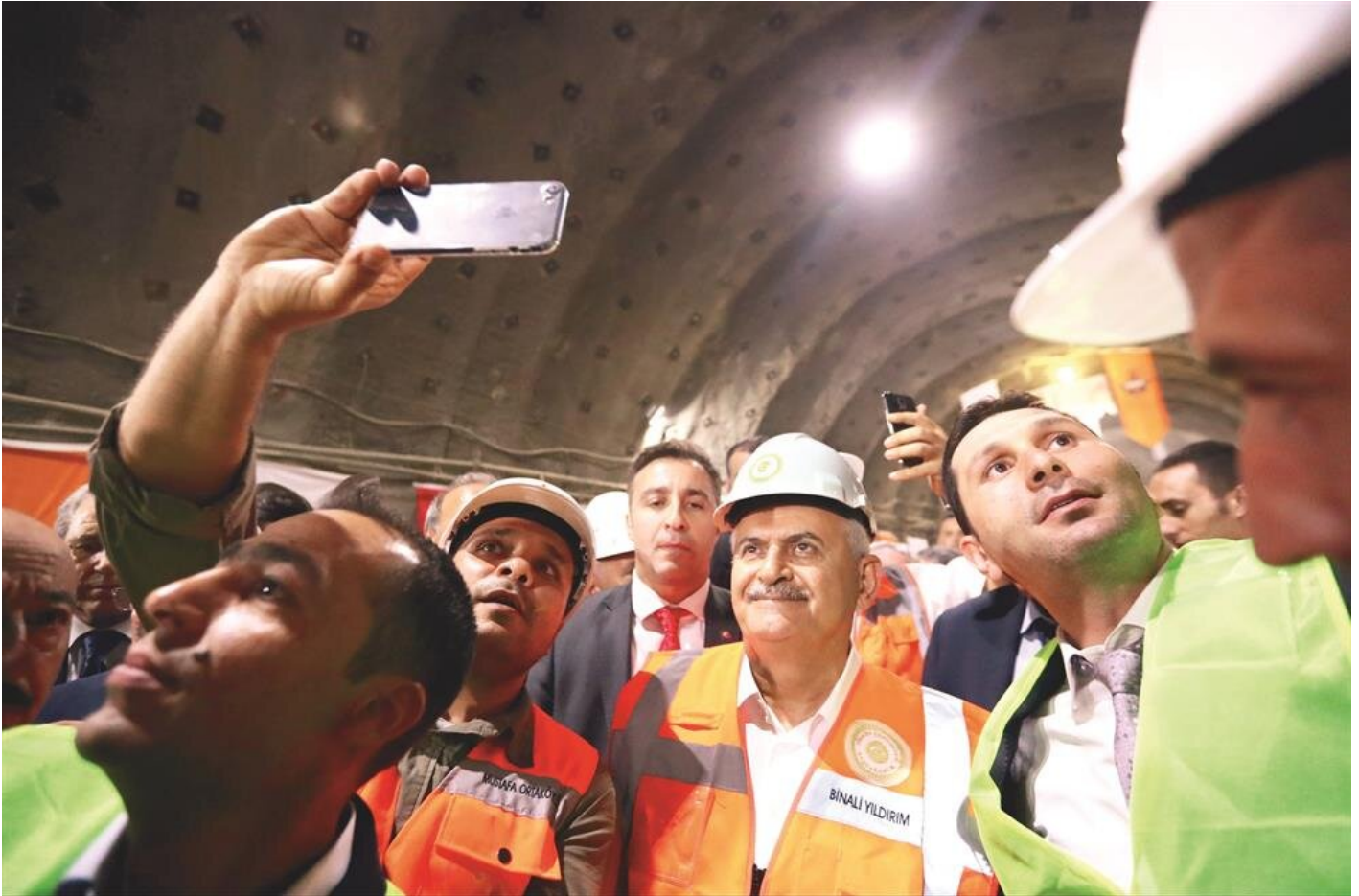
Tünel inşaatında çalışan nişçiler, Yıldırım'la özçekim yaptı.

Başbakan, şöyle konuştu: “İzmir her şeyin en güzeline layık. İzmir milletvekili seçildiğimde dedim ki ‘35 İzmir 35 proje’. Bu projelerin 8 tanesi bitti. 14’ü hala devam ediyor. Diğerlerinin de proje çalışmaları yapılıyor. İzmir’in çığgın projesini de hazırladık. Nasıl İstanbul’un Marmaray’ı varsa İzmir’in de İzmir Körfez Geçişi var. Körfezi kuzeyden güneye denizin altında ve üstünden geçecek muazzam bir proje hazırladık. İzmir isteyince biz de bu projeye, düğmeye basacağız. Bizim işimiz hizmet, gücümüz millet. Siyaset bizim için millete hizmet anlamına geliyor. İzmir isteyecek biz de yapacağız.”