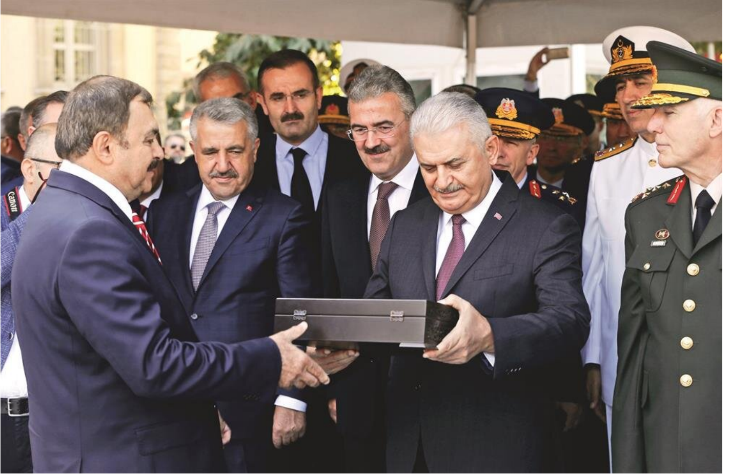
Süvariler tarafından getirilen toprak ve Türk bayrağı, Bakan Eroğlu tarafından Yıldırım'a takdim edildi.

Buca ilçesinde gençlik merkezi açılışı ve Alsancak, Göztepe ve Karşıyaka statlarının temel atma törenine katılan Yıldırım, İzmir’in düşman işgalinden kurtuluşunun 95. yıldönümünü kutladı. Yıldırım, başta cumhuriyetin kurucusu Gazi Mustafa Kemal Atatürk olmak üzere bağımsızlık mücadelesinin bütün kahramanlarını rahmetle, minnetle, şükranla anarak, Selçuk’un düşman işgalinden kurtuluşu vesilesiyle İzmirliyle bir araya geldiğini, kente kazandırdıkları yeni eserlerin açılışını gerçekleştirdiklerini anlattı.