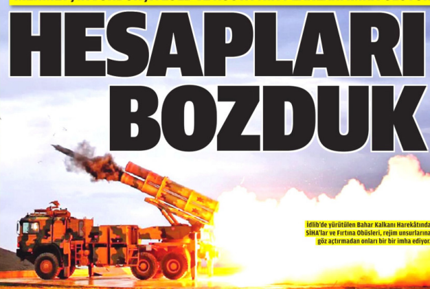
İdlib'de yürütülen Bahar Kalkın Harekati'nde SİHA'lar ve Fırtına Obüsleri, rejim unsurlarına göz açtırmadan onları bir bir imha ediyor.

Türk ordusunun İdlib'deki imha kabiliyeti, savaş kurallarını değiştirdi. Uzmanlar: Türk insanının, 27 Şubat saldırısına karşı 15 Temmuz'daki gibi tek yürek olması Rusya'nın hesaplarını bozdu