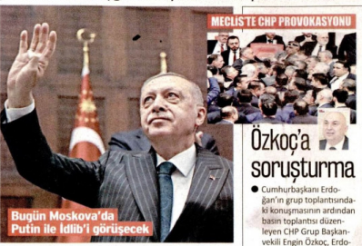
Buğün Moskova'da Putin ile İdlib'i görüşecek

● Türkiye'nin Suriye'de verdiği mücadeleyi karalamaya çalışan işbirlikçilere da seslenen Başkan Erdoğan, "Verdiğimiz mücadelede hem sahada zafere yürüyeceğiz hem de bu müstevli destekçilerini milli irade ayakları altında ezerek ülkemizi hedeflerine ulaştıracağız. Türkiye'nin bu tarihi mücadelesini fitneye, fitneyi ayakta tutmaya çalışan kim olursa olsun, hayyisütsüddir, şerifsüddir, alıktır, haindir" diye konuştu. ● 9'DA