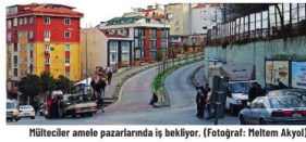
Mülteciler amele pazarlarında iş bekliyor.