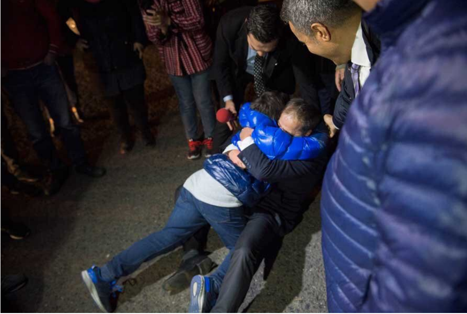
İşte Uğur Dündar'ın karar sonrasındaki yorumları ve gözyaşı döktüğü o anlar: