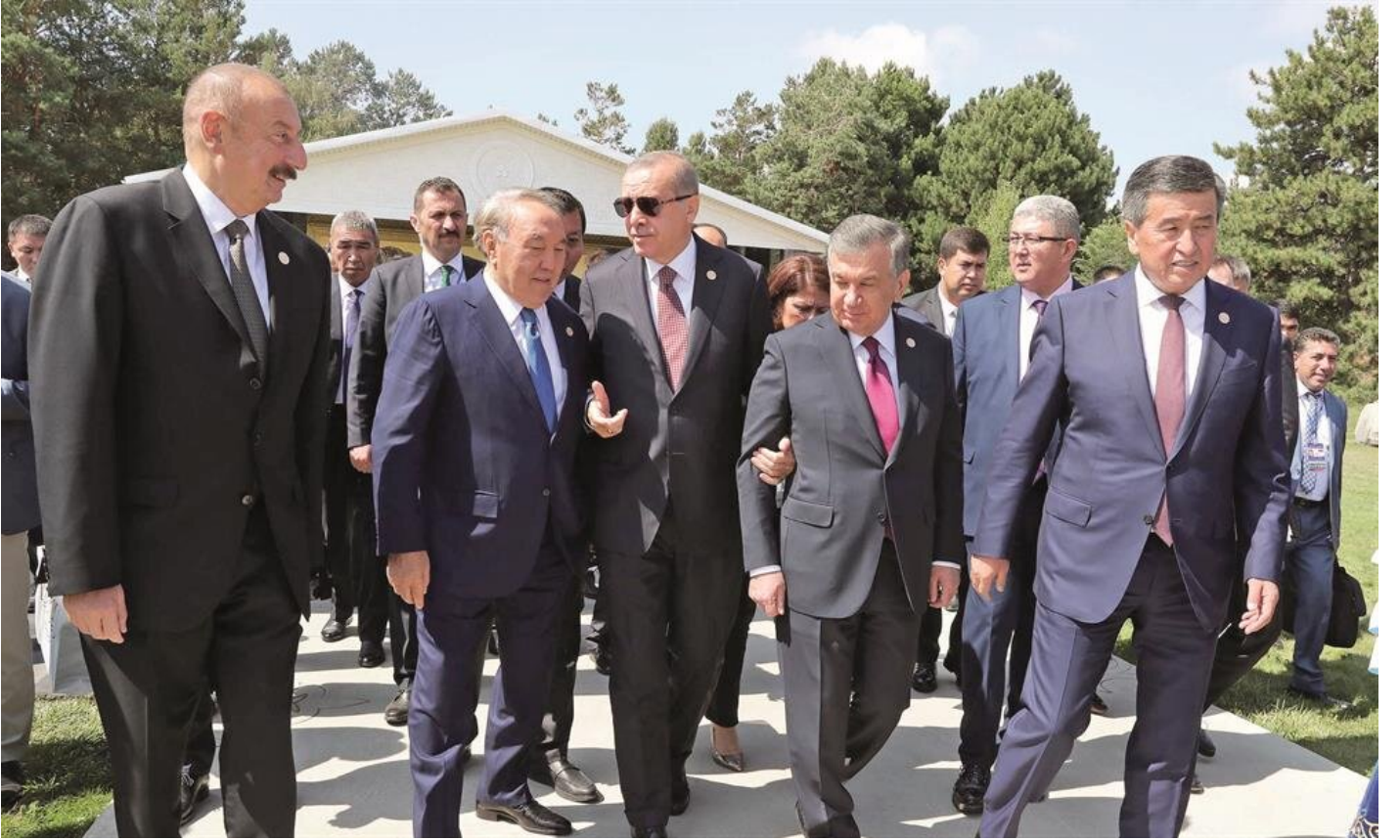
İlham Aliyev - Nursultan Nazarbayev - Tayyip Erdoğan - Şevket Mirziyayev - Sooronbay Ceenbekov

Erdoğan, son dönemde uluslararası teamül, prensip ve kuralların hoyratça ihlal edildiği bir dönemden geçildiğine işaret ederek, isim vermeden ABD'yi eleştirerek, şu değerlendirmelerde bulundu: "Bazı ülkeler, uluslararası meselelerin çözümünde diplomasi, diyalog ve çok taraflılık yerine; tehdit, baskı ve şantajı öne çıkarmaya çalışıyorlar. Ticaret kısıtlamaları, gümrük vergileri ve yaptırımlar gibi araçlar üzerinden, uzun yılların eseri olan anlaşmalar bir anda anlamsız hale gelebiliyor. Türkiye, uluslararası toplumla dayanışma içinde diyalogu, diplomasiyi, adaleti ve hukuku savunmaya devam edecektir. Türk devletleri olarak kendi aramızda sergileyeceğimiz iş birliği ve dayanışma, uluslararası sistemin adaletli şekilde işletilmesine de katkıda bulunacaktır."