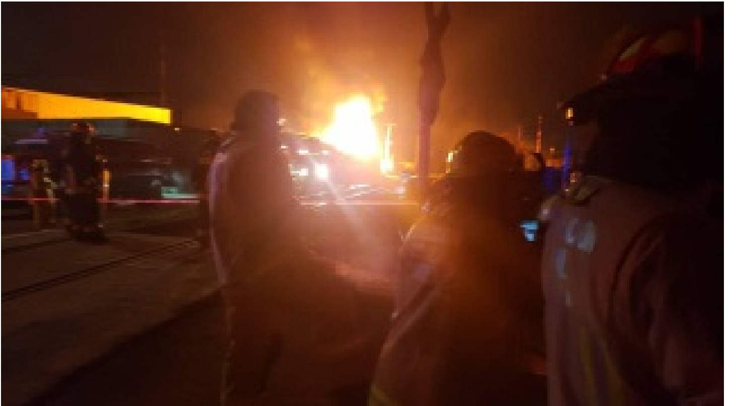
Dolmabahçe Sarayı'nda yangın!