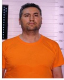
2 NOLU FOTOĞRAF

1 nolu fotoğrafta gösterilen 143 filo koridor güvenlik kamerası CH7 2016-07-16-03-33-03 serinolu görüntünün 03.22.11 ile 03.22.23 zaman aralığındaki görüntüsünde koridor içerisinde görülen şahıs ile 2 nolu fotoğrafta Olay Yeri İnceleme Şube Müdürlüğünde çekilen fotoğraflar arasında benzerlikler görülen şahsın;