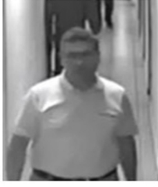
1 NOLU FOTOĞRAF