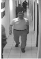
3 NOLU FOTOĞRAF

1 nolu fotoğrafta gösterilen 143 filo koridor güvenlik kamerası CH7 2016-07-16-03-33-03 serinolu görüntüsün 03.22.11 ile 03.22.23 zaman aralığındaki görüntüsünde koridor içerisinde görülen şahıs ile 2 nolu fotoğrafta Olay Yeri İnceleme Şube Müdürlüğünde çekilen fotoğraflar arasında benzerlikler görülen şahıs;