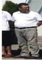
4 NOLU FOTOĞRAF