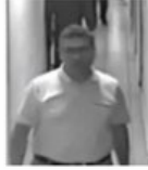
1 NOLU FOTOĞRAF

01.04.2017 - 11:27 | Son Güncelleme : 02.04.2017 - 18:31