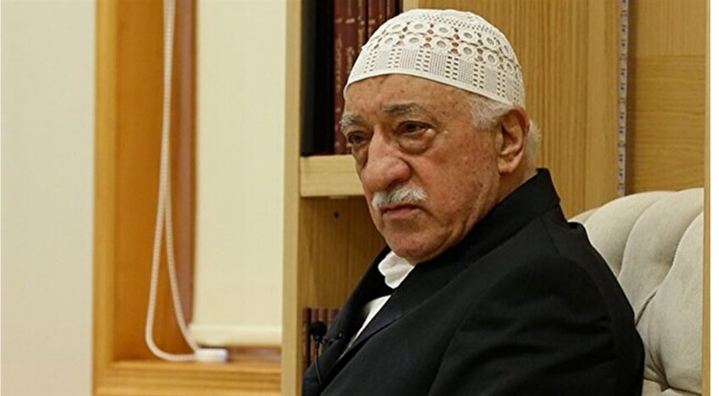
FETÖ elebaşı Fetullah Gülen

Haber Merkezi · 25 Ağustos 2016, 17:38 · Son Güncelleme: 25 Ağustos 2016, 17:53 · AA