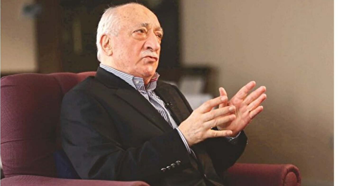
FETÖ elebaşı Fetullah Gülen

Haber Merkezi · 03 Ağustos 2016, 15:32 · AA