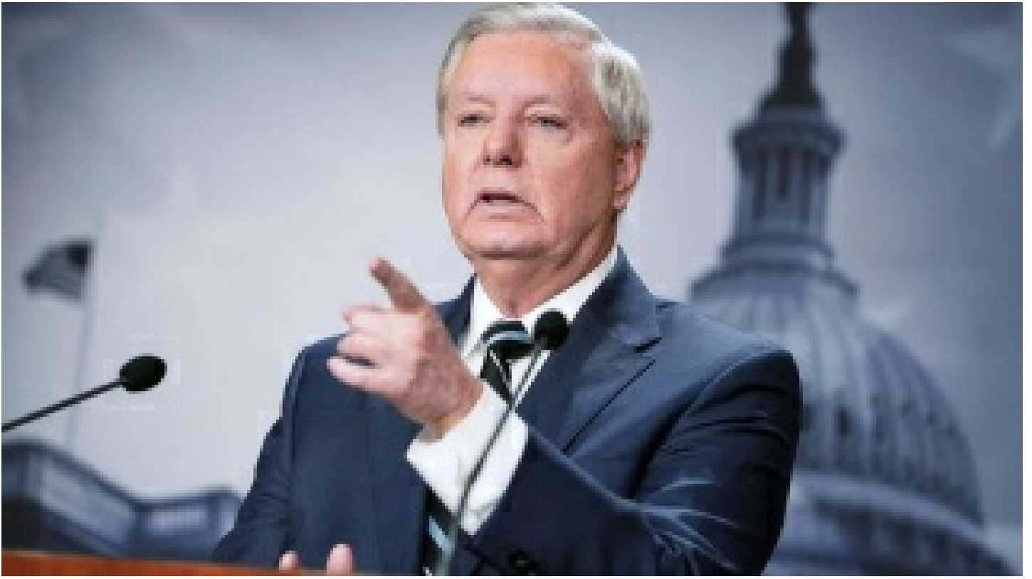
ABD'li senatörün hayali 'Putin'e suikast'