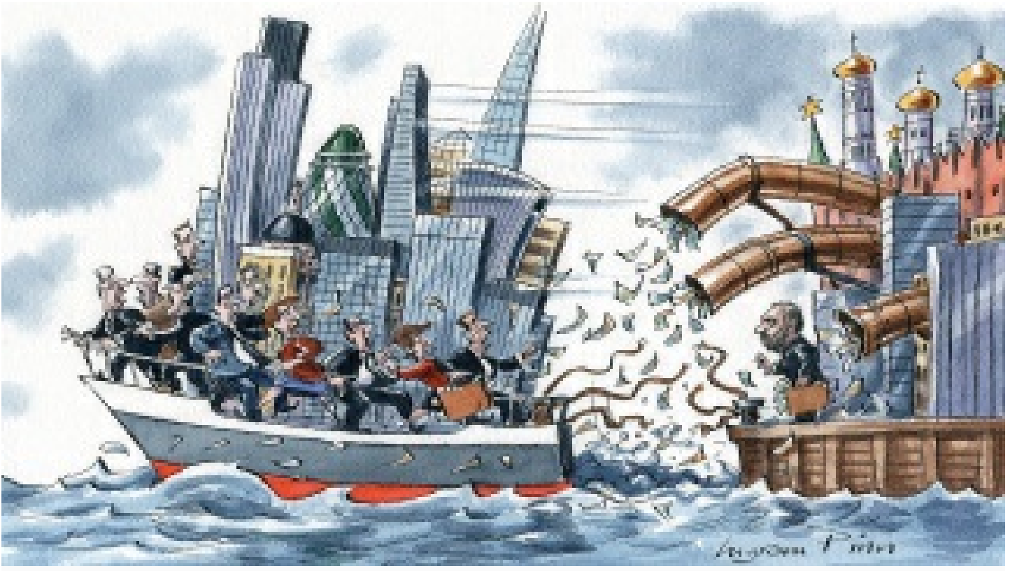
Putin'in oligarklarla mücadelesi