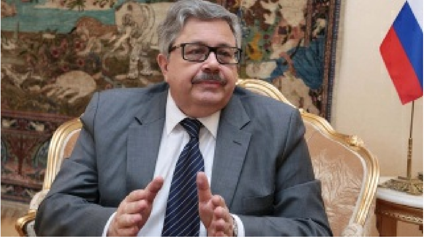
Rus Büyükelçi Yerhov: Yaptırımlar geri adım attırmayacak!