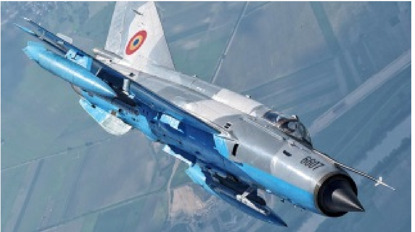
Önce uçak sonra helikopter ardından gemi