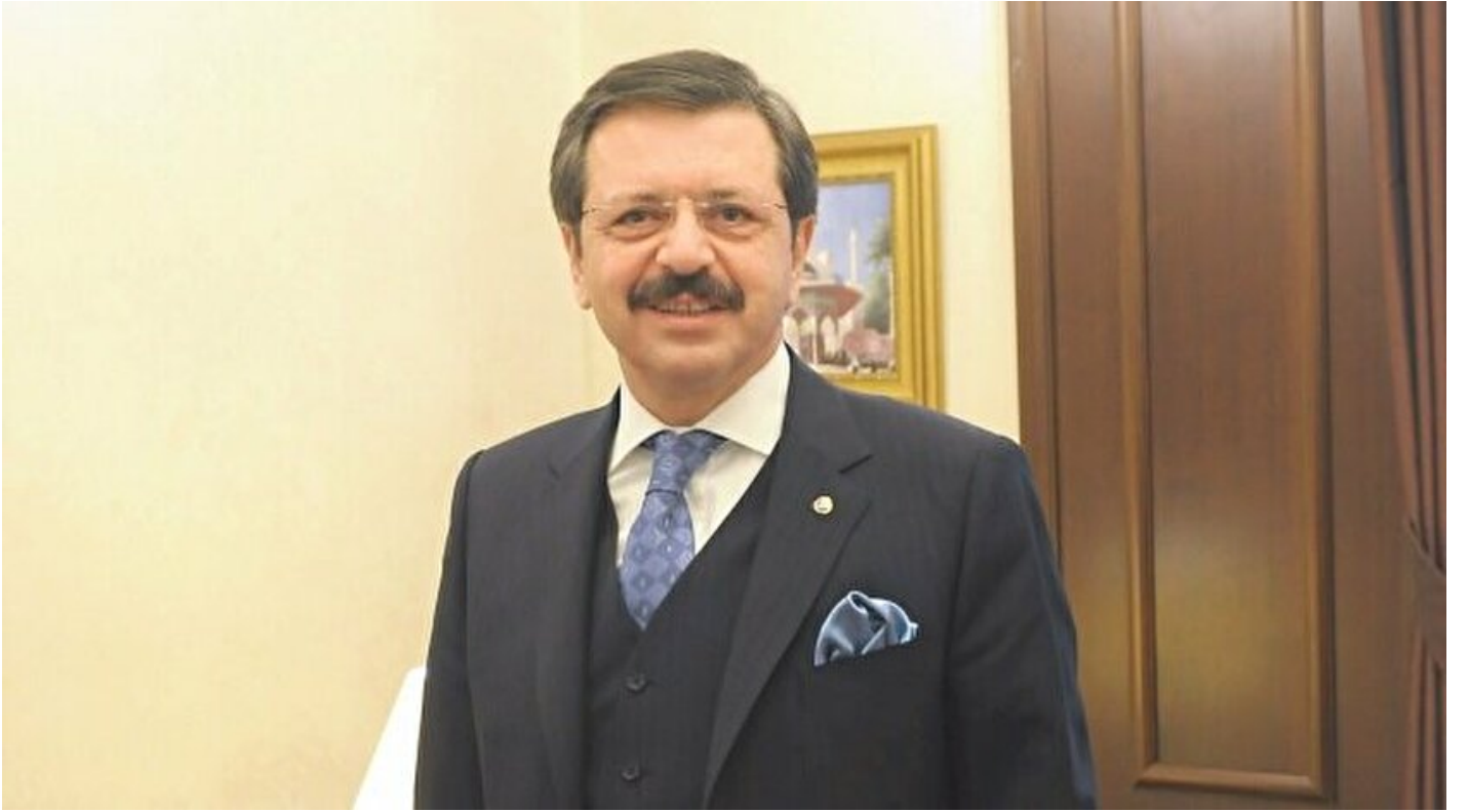
Türkiye Odalar ve Borsalar Birliği (TOBB) Başkanı Rifat Hisarcıkloğlu