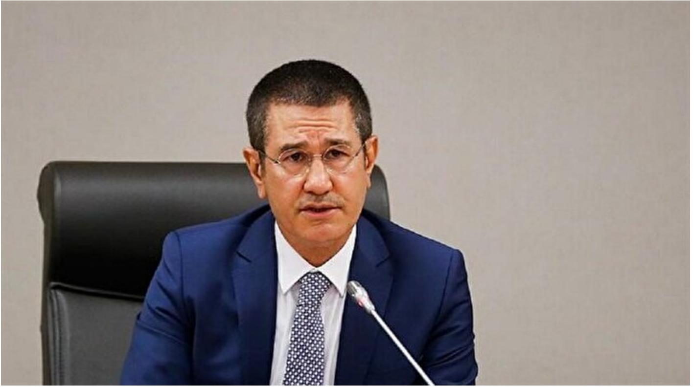
Başbakan Yardımcısı Nurettin Canikli