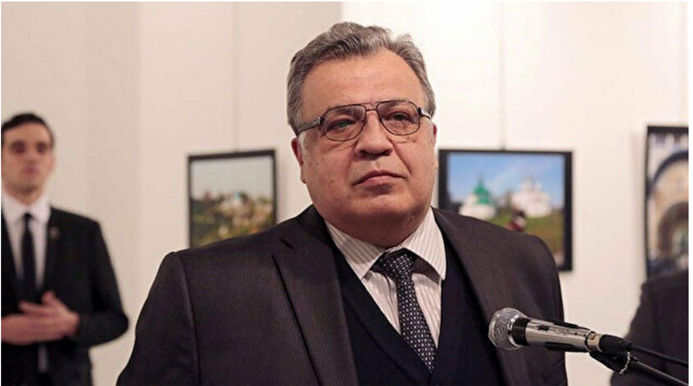
Andrey Gennadiyevich Karlov