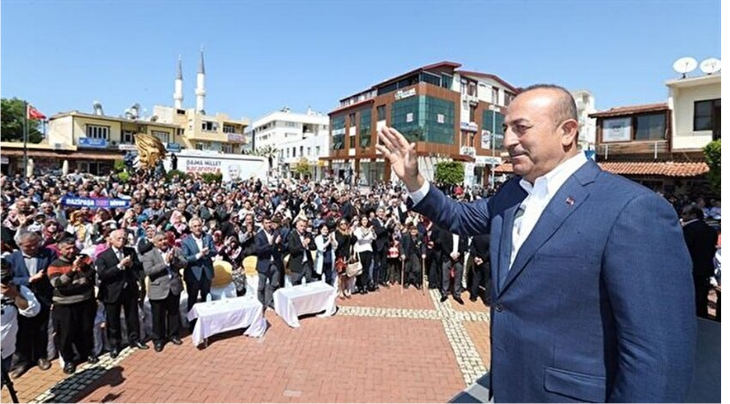
Dışişleri Bakanı Mevlüt Çavuşoğlu.

Haber Merkezi · 15 Nisan 2017, 14:32 · Son Güncelleme: 15 Nisan 2017, 14:50 · AA