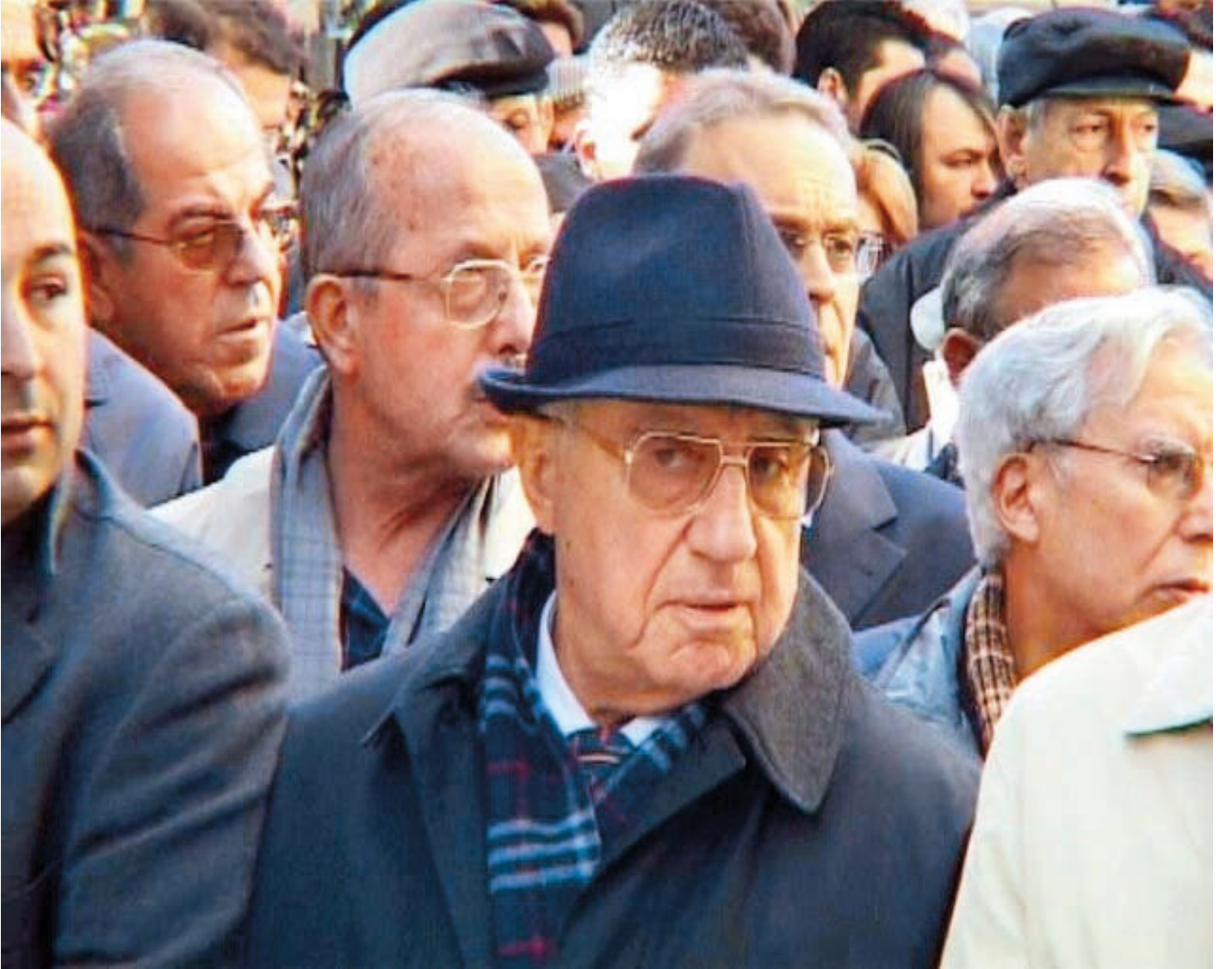
İsmail Hakkı Karadayı