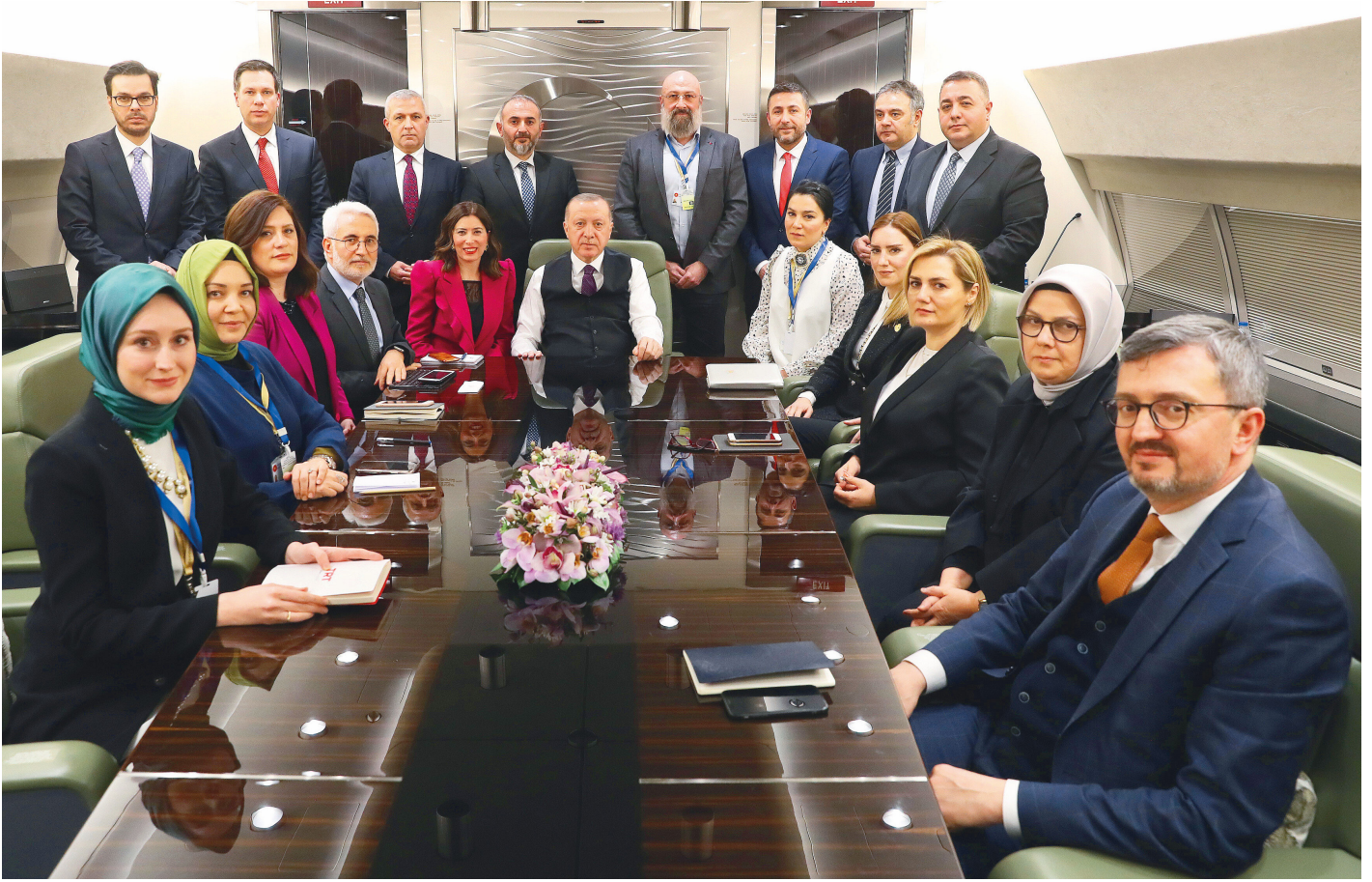
Cumhurbaşkanı Erdoğan Azerbaycan dönüşü uçaқта gazetecilerin sorularını yanıtladı.

Aç tavuk kendini buğday ambarında sanırmış. Başka bir şeye gerek var mı? 50 yıl, 60 yıl oldu hep böyle söylediler. Yani maalesef yalandan başka hiçbir sermayeleri yok. Şimdi hepsi bir araya gelecekler... Bizim Erbakan Hoca'nın bir lafı var derdi ki "40 çürük yumurtadan bir sağlam yumurta olmaz." Bunların hepsi çürük yumurta. Bunlardan bir sağlam yumurta olmaz. Hepsi bir araya gelsin, topu bir araya gelsin, bunlardan bir şey olmaz.