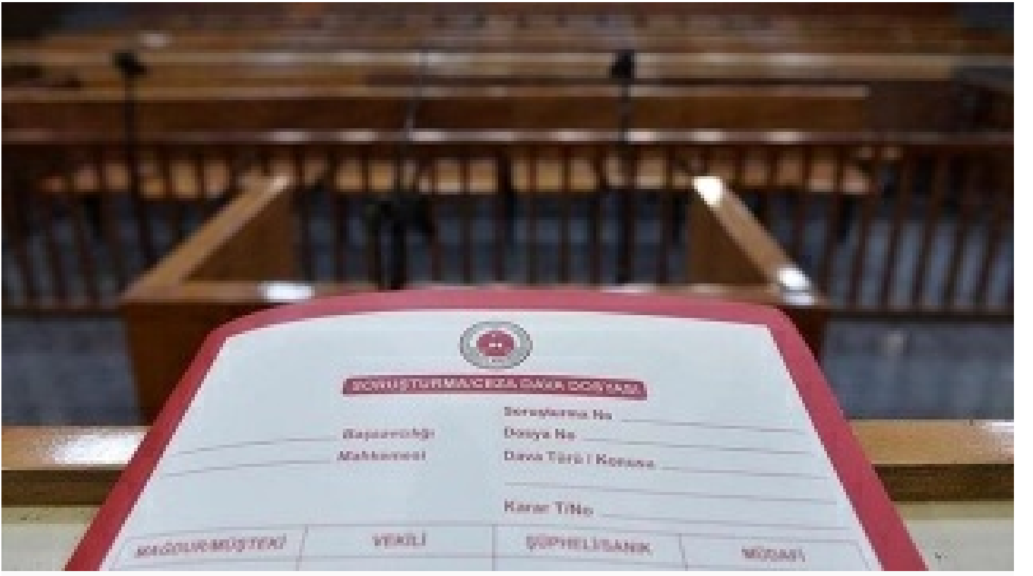
Bekçiyi öldüren sanık hakkında mütalaa açıklandı