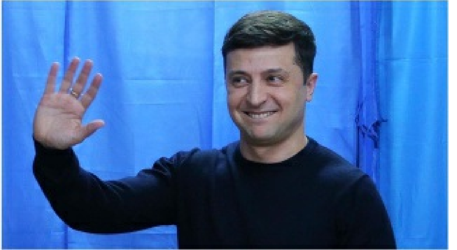
Zelenskiy Ukrayna'dan ayrıldı mı?