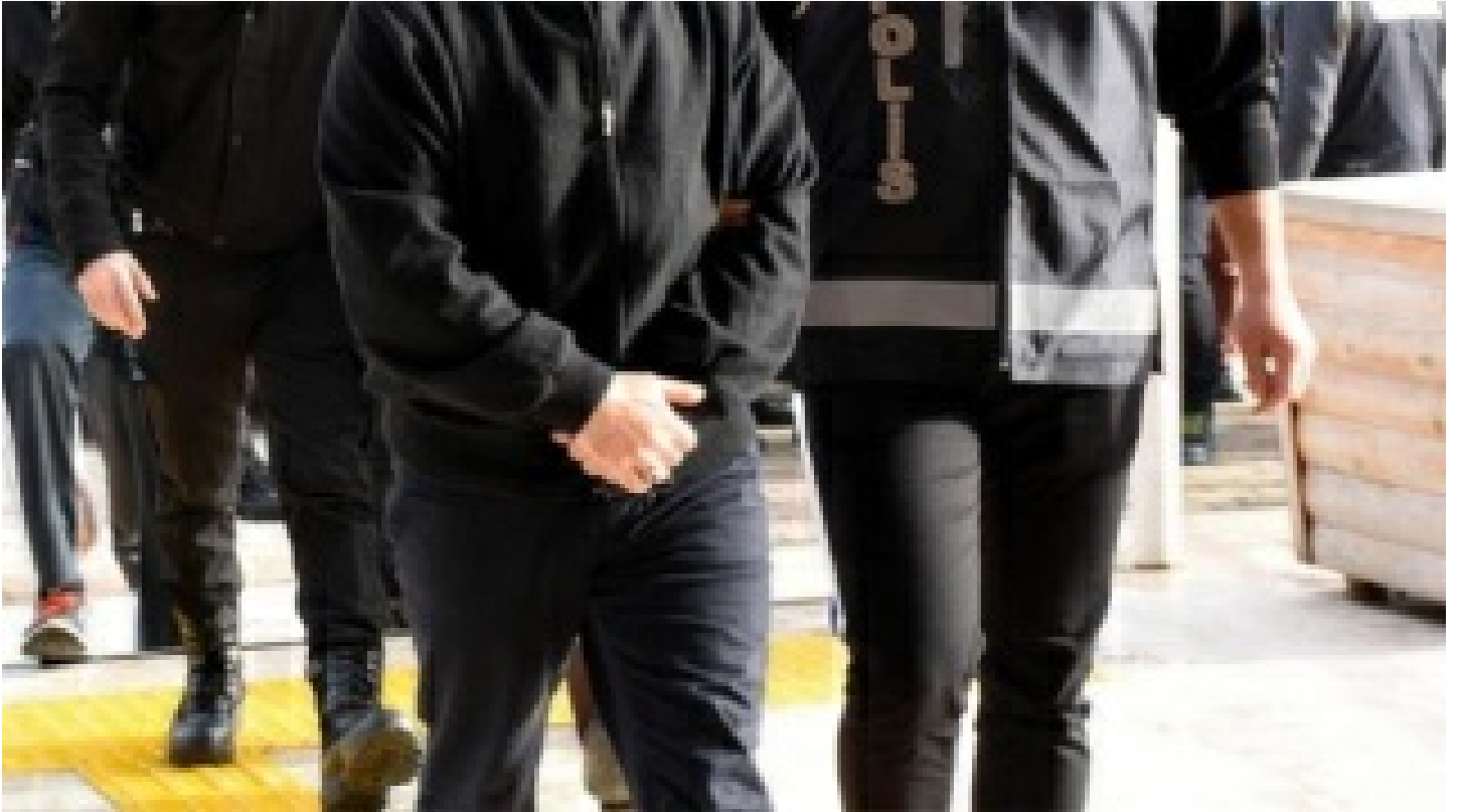
Balıkesir merkezli 4 ilde FETÖ operasyonu: 26 gözaltı