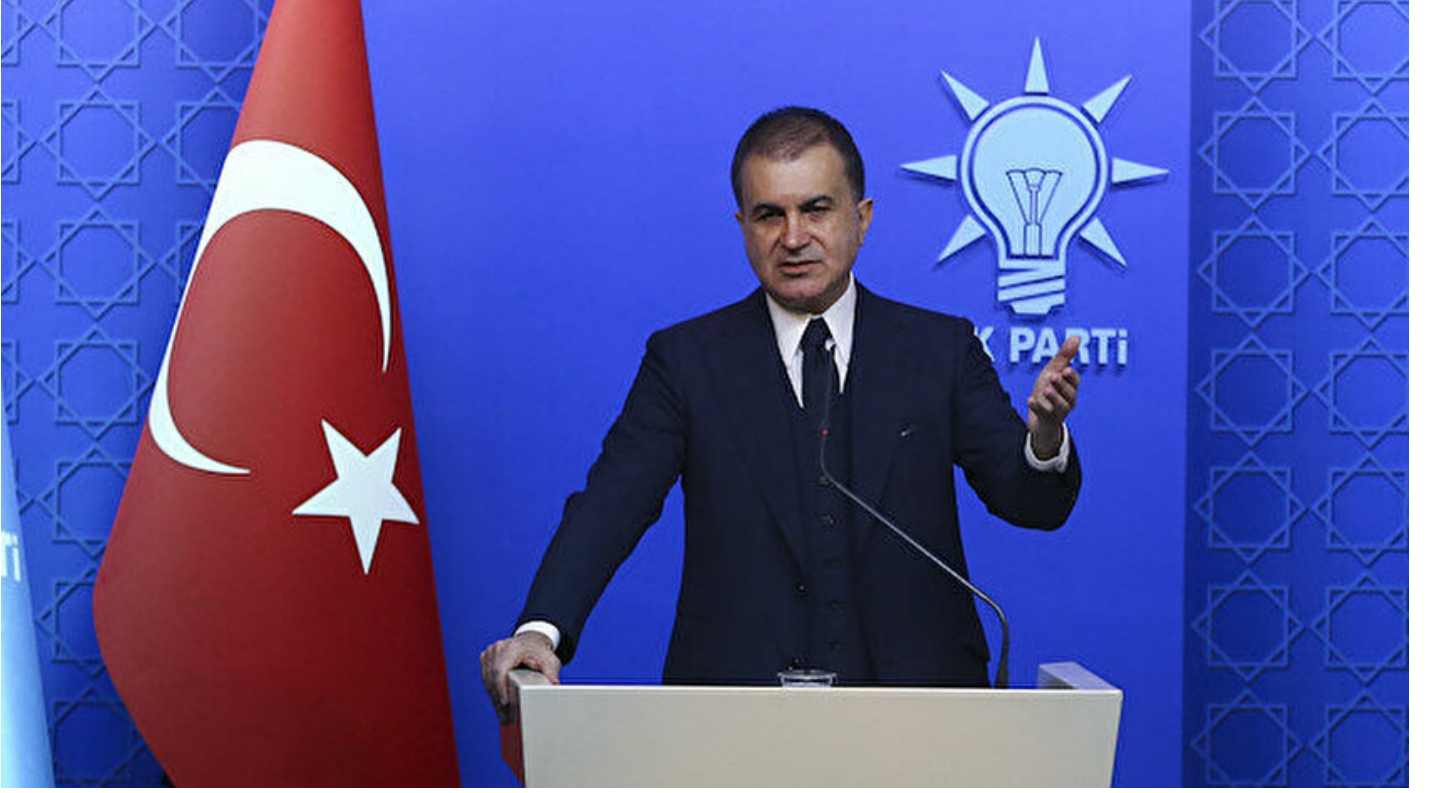
AK Parti Sözcüsü Ömer Çelik

Haber Merkezi • 02 Nisan 2019, 00:05 • Son Güncelleme: 02 Nisan 2019, 00:39 • Yeni Şafak