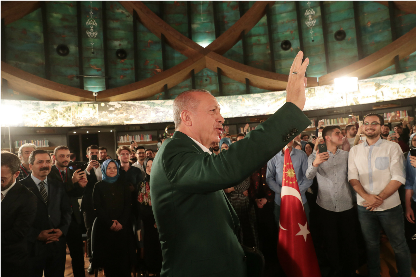
Cumhurbaşkanı Erdoğan, 'Cumhurbaşkanı ile Seçim Özel' programında gençlerle bir araya geldi.

"Büyük Çamlıca Camisi'nin ramazan öncesi açılışını da yapacağız. Bu oyunlara gelmeyelim diye. Çünkü bunlar da bir tahriktir. Tahrik unsurlarını bozalım diye açıklamasını yapmak durumunda kaldım. Orada mesela bir sergi yapıldı, orada Kur'an tilaveti de yaptık. Belli bir bölümünde şu anda namaz da kılınıyor. Bunları da aşmak bizim için sorun değil aşarız ama getirisi, götürüsü nedir? Bunu da burada açıklamam doğru olmaz. Bunun bir götürüsü var. O, bizim için faturası çok daha ağırdır. Unutmayalım dünyanın çok çeşit ülkelerinde bizim binlerce camimiz var. Acaba bunu söyleyenler, bu camilerin başına ne gelir, bunu düşünüyor mu? Şu anda kundaklama hareketleri, bir çok şeyler yapılıyor. Bunları düşünmeden, bunların hesabını yapmadan söylüyorlar. Kusura bakmasınlar bunlar dünyayı tanımıyorlar, muhataplarını bilmiyorlar. Ben bir siyasi lider olarak bu oyuna gelecek kadar istikametimi kaybetmedim. İslam dünyasının yükünü çekiyoruz. 'Nerede, ne oluyor, ne olabilir?' Bunların hepsini düşünmek zorundayız. Onun için hassas olacağız, dikkatli olacağız."