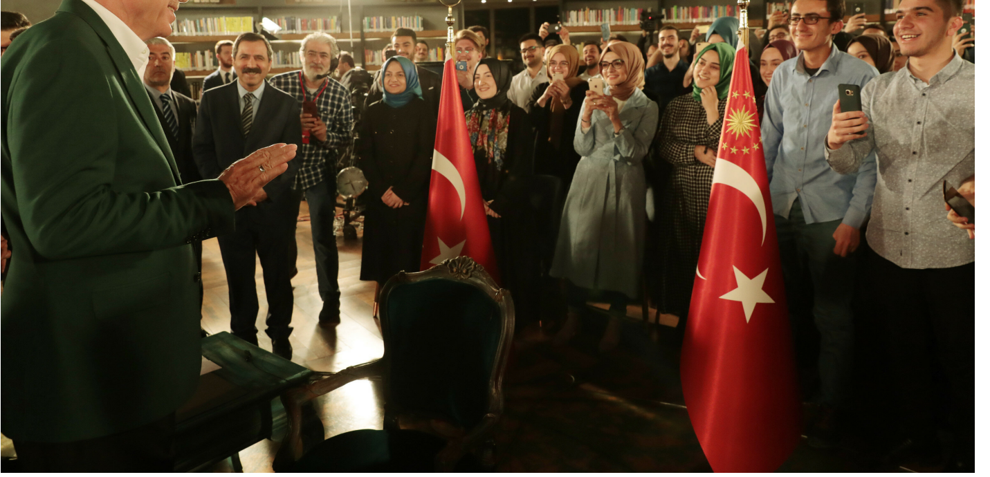
Cumhurbaşkanı Erdoğan, gençlerle bir araya geldi.