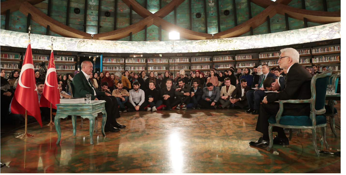
Cumhurbaşkanı Erdoğan, "Cumhurbaşkanı ile Seçim Özel" programına katıldı.

Cumhurbaşkanı Erdoğan, Özgür Suriye Ordusu'nun, Mehmetçiğin çok ciddi yükünü aldığını, planlayanın, koordine edenin Mehmetçik olduğunu anlatarak, "Özgür Suriye Ordusu'nun liderler takımı beni ziyarete geldi. Onların gözünde 'biz bu işi bitireceğiz' kararlılığı vardı. Ben bunu tabii Amerikalılara anlatamamıştım. Sayın Trump ile konuştuğumuz zaman 'Benim generaller bana şöyle şöyle şöyle diyor.' diyordu. İnanmıyordu. Benim generaller de bana böyle böyle böyle diyor. Bizim generallerimiz 'Biz Özgür Suriye Ordusu ile Rakka'yı hallederiz.' dedi. Özellikle buradaki YPG, PYD güvenilir takımlar değildir. Bunlar tam manasıyla teröristtir. Bunların hala terörist olduğunu kabul etmediniz ama gün ola harman ola edeceksiniz." diye konuştu.