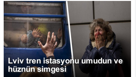
Lviv tren istasyonu umudun ve hüznün simgesi