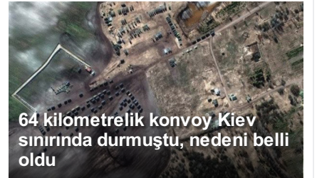
64 kilometrelik konvoy Kiev sınırında durmuştu, nedeni belli oldu