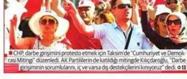
■ CHP, darbe girişimini protesto etmek için Taksim'de "Cumhuriyet ve Demokrasi Mitingi" düzenledi. AK Partililerin de katıldığı mitingde Kılıçdaroğlu, "Darbe girişiminin sorumluları, iç ve varda dış destekçilerini kuruyor" dedi. 21