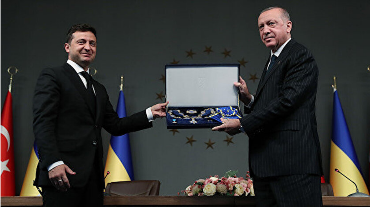
Cumhurbaşkanı Erdoğan ve Ukrayna Devlet Başkanı Zelenskiy

Haber Merkezi · 16 Ekim 2020, 18:22 · Son Güncelleme: 16 Ekim 2020, 19:45 · AA