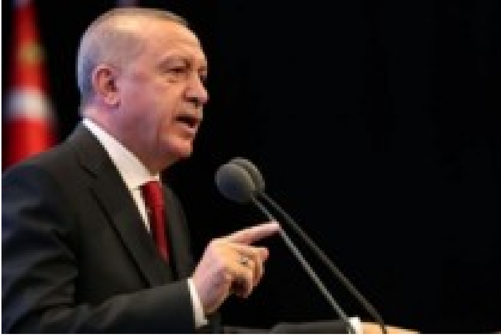
Erdoğan'dan Kılıçdaroğlu'na 'FETÖ'nün siyasi ayağı' yanıtı!