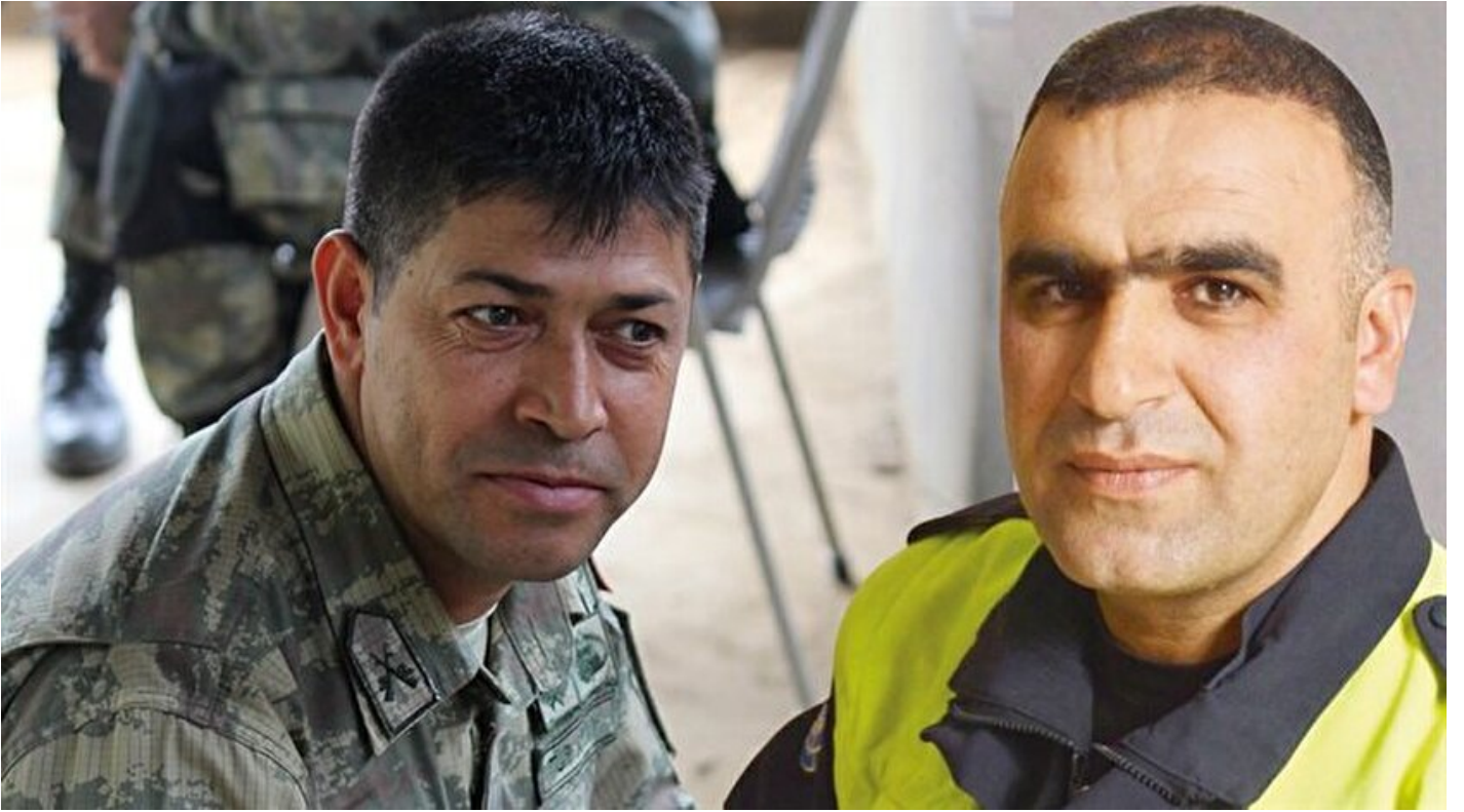
Ömer Halisdemir ve Fethi Sekin