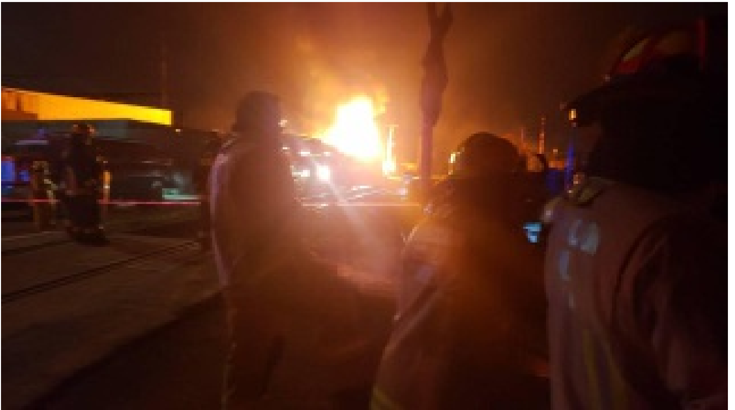
Dolmabahçe'de yangına 1 dakikada müdahale