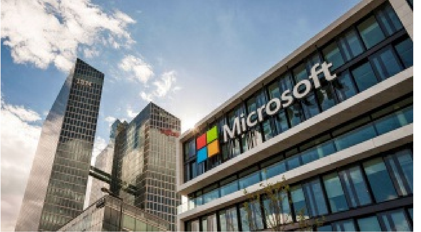
Microsoft, Rusya'da tüm hizmetlerini durdurdu