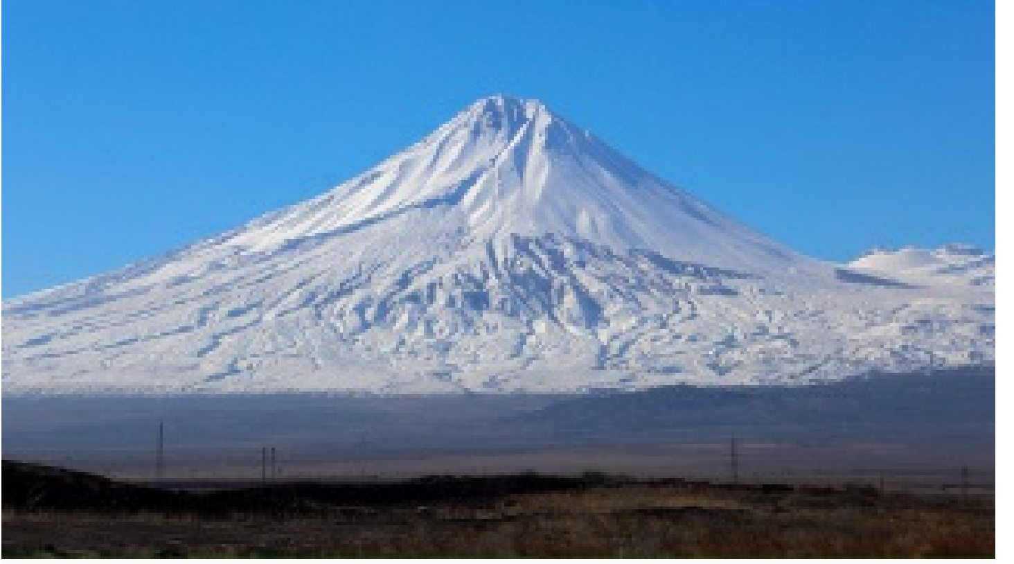
Ađrı Dađı Kış Tırmanışı, 6 Mart Pazar günü başlayacak