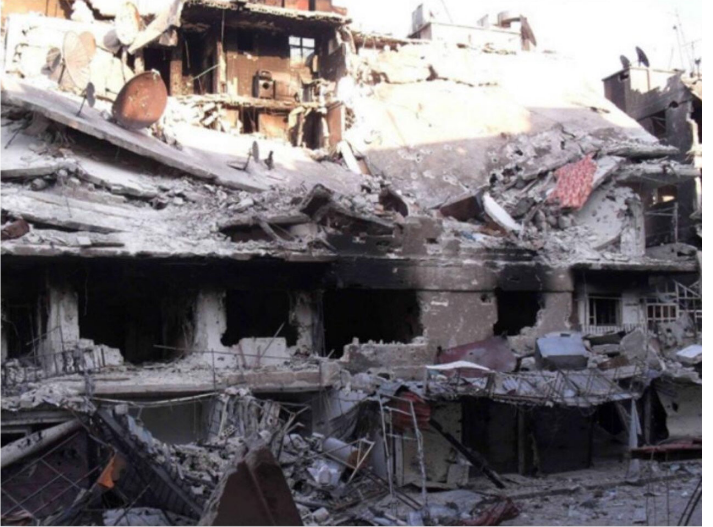
Meclis'e atılan bombanın ardından çöken duvarlar.

Buna rağmen darbeci askerler ile firari FETÖ'cüler, TBMM'ye uçaklardan bomba atılmadığını, Meclis'e önceden yerleştirilen bombaların uzaktan kumanda ile patlatıldığı yalanına sarıldı.