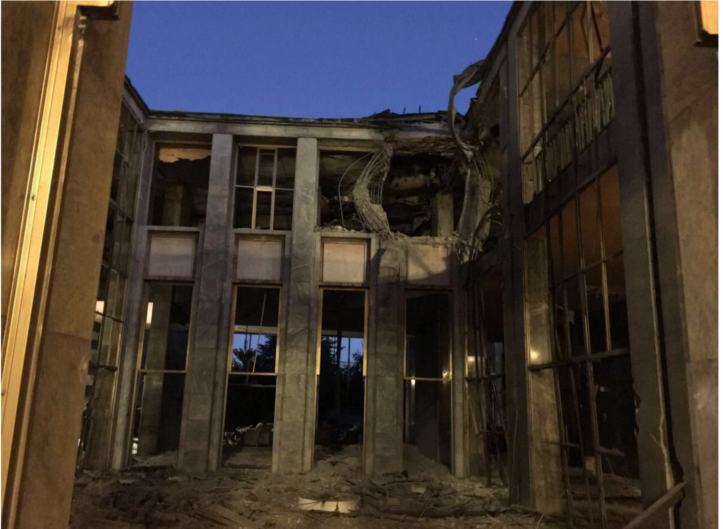
Bombaların ardından TBMM'de hasar gören kısımlardan biri.

Darbeci pilot Balıkçı, "Son anda ihtiyaç nedeniyle bana uçuş görevi verildi ve ben maalesef TBMM'yi bombaladım." itirafında bulunurken, darbeci Türk de uçağında 6 "MK-82 klasik mühimmat" bulunduğunu, bunlardan 4'ünü TÜRKSAI'a ikisini de Meclise attığını ifade etti.