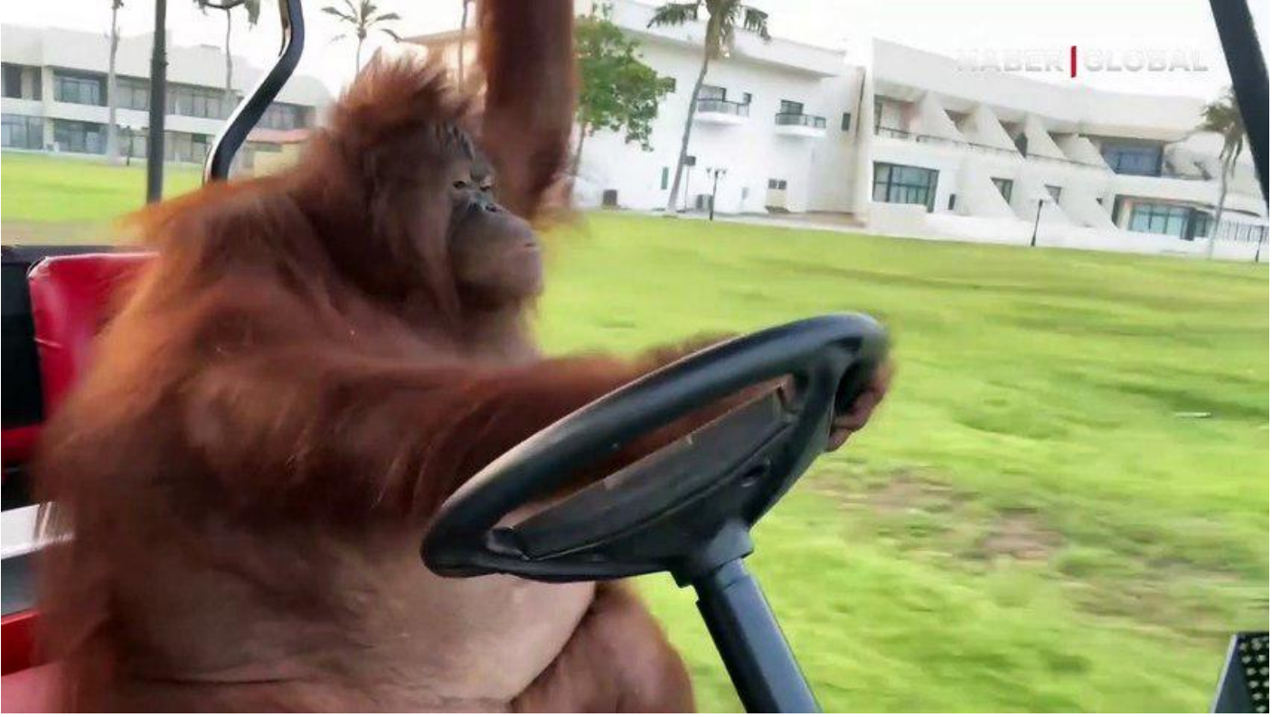
Herkes onu konuştu! Golf arabası süren orangutan sosyal medyayı salladı Sosyal Medya