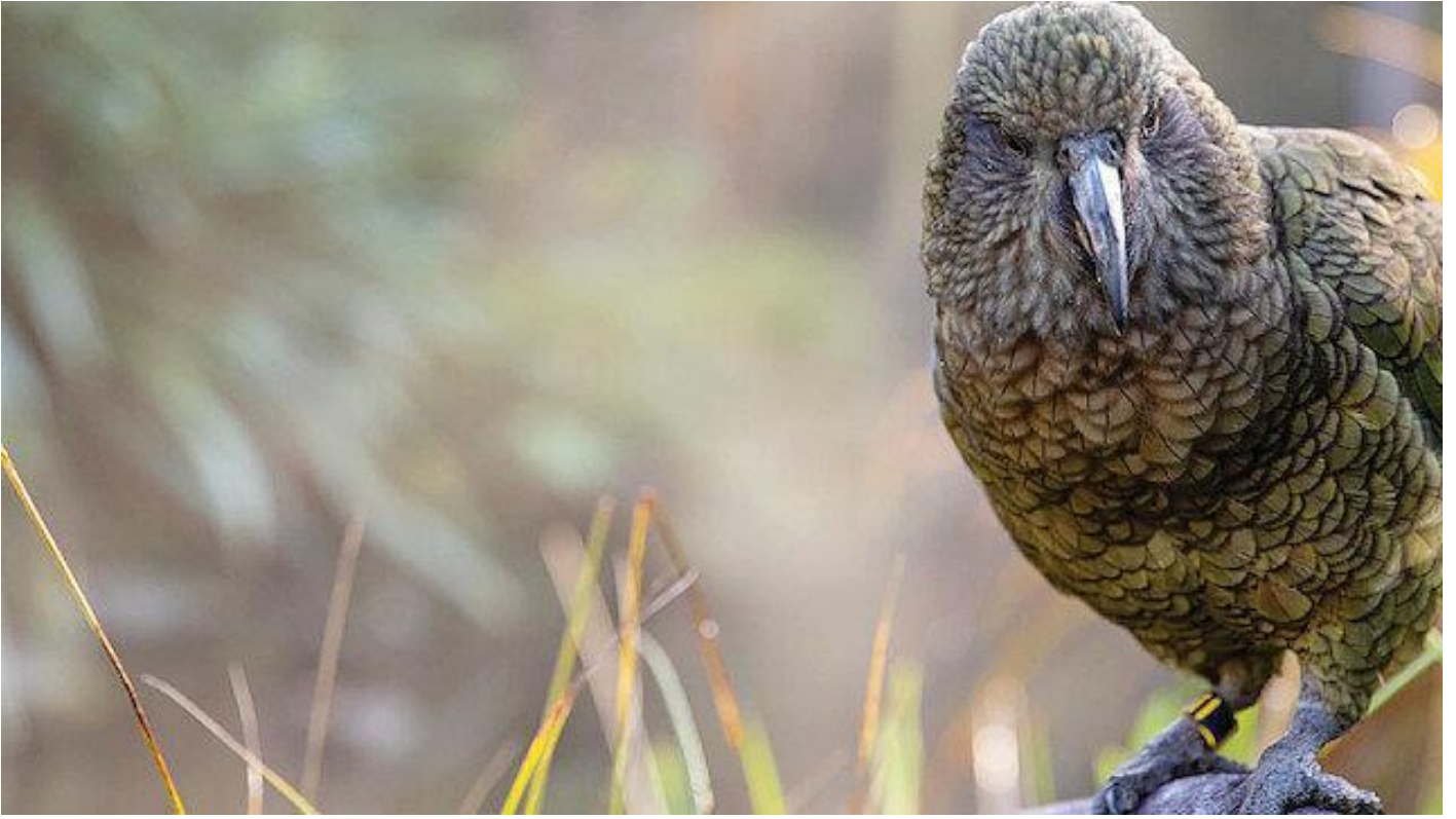
Kamerayı çalan papağan kaçış anını böyle kaydetti! Sosyal Medya