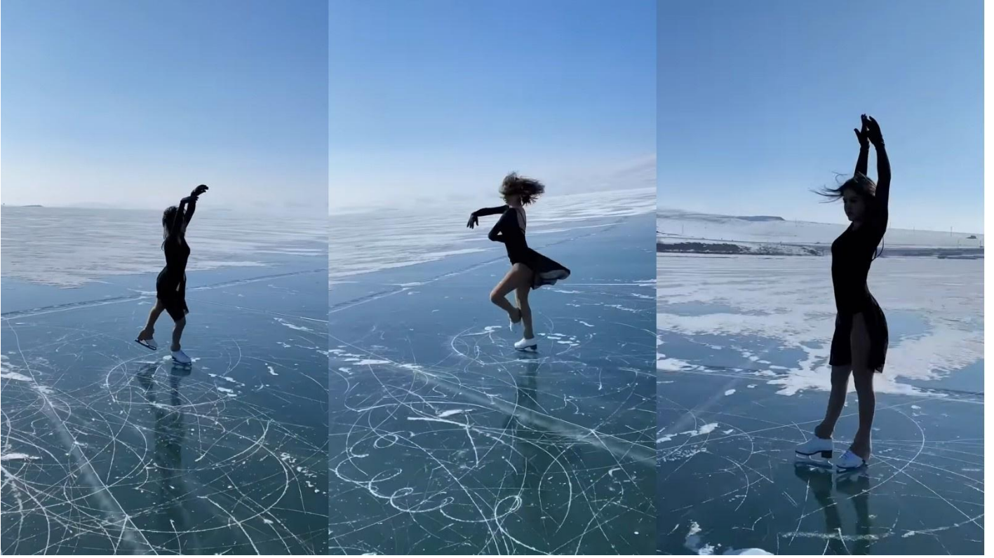
Milli sporcudan ıldır Gölü'nde buz pateni gösterisi Sosyal Medya