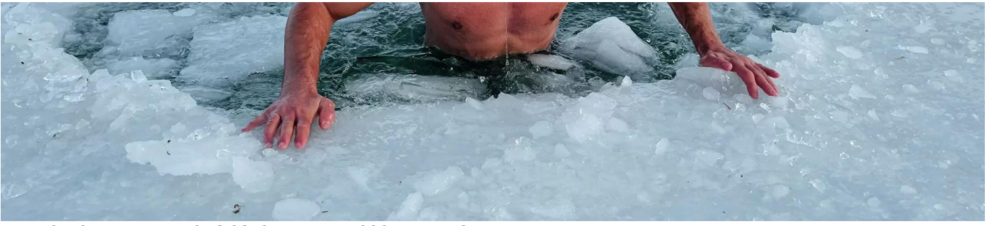
YouTuber buz tutmuş göle daldı, hipotermi tehlikesi geçirdi Sosyal Medya