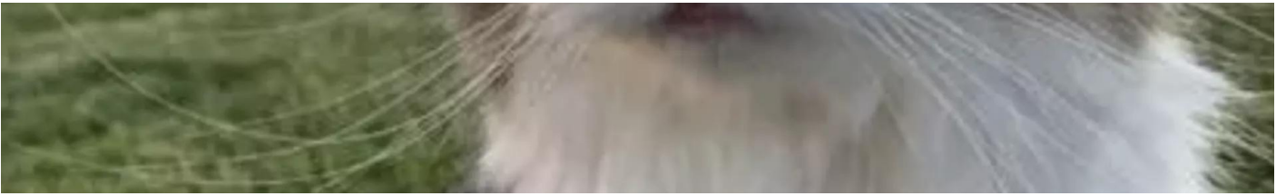
Uzay gözlü kedi sosyal medyanın yeni fenomeni oldu Sosyal Medya