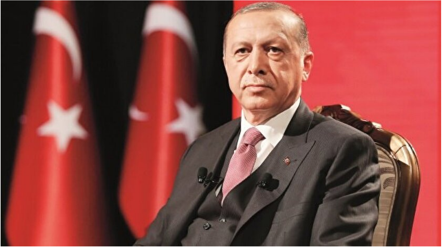
Cumhurbaşkanı Tayyip Erdoğan