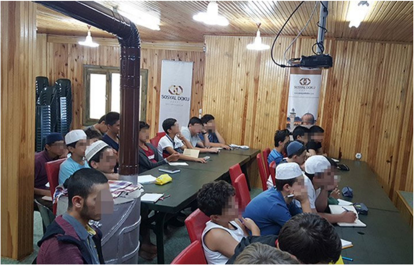
Vakıf özellikle çocuklara yönelik 'etkinlikleri' ile dikkat çekiyor

Sosyal Doku Vakfı, çalışmalarında ise şu temel karakteri esas aldığı savunuluyor;