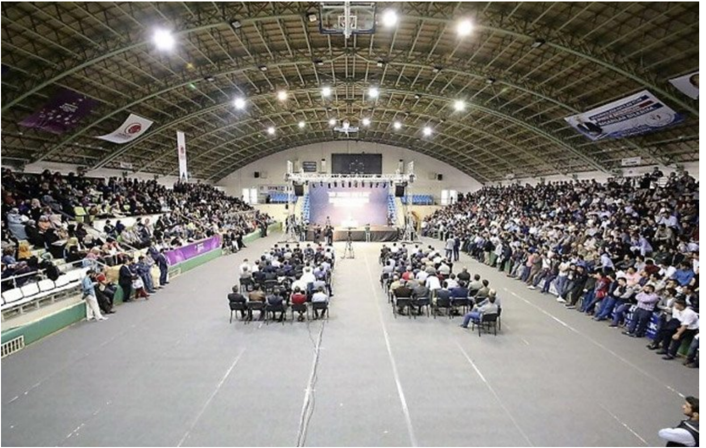
Sosyal Doku Vakfı'nın yüzbinlerce 'gönüllüsü' bulunuyor.