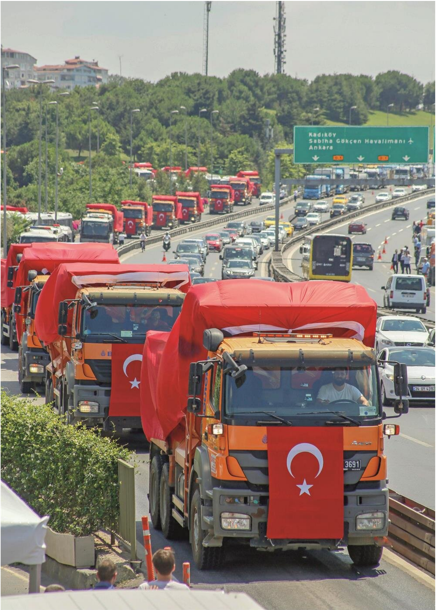
Darbe girişimi sırasında askeri araçların kırsallardan çıkışını engelleyen kamyonlar dün dev Türk bayrakları ile donatılarak 15 Temmuz Şehitler Köprüsü'nden geçiş yaptı.