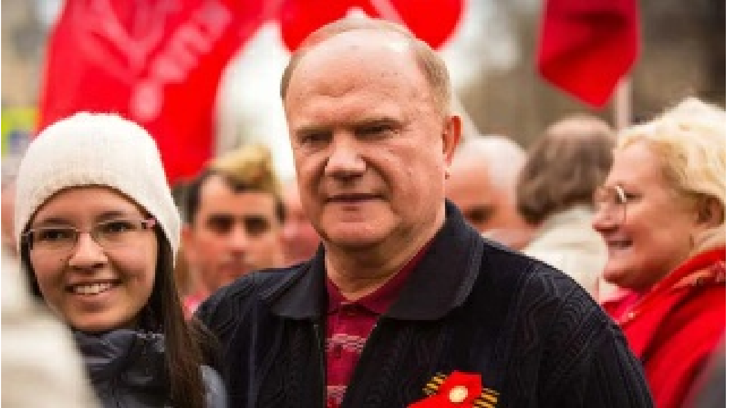
Zyuganov'tan Rusya'nın harekâtına destek