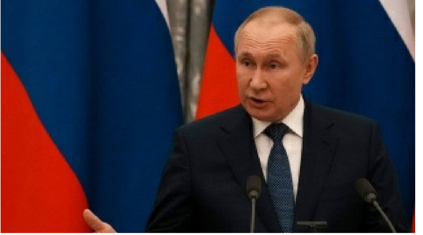
Putin'den ülkelere ilişkileri normalleştirme çağrısı