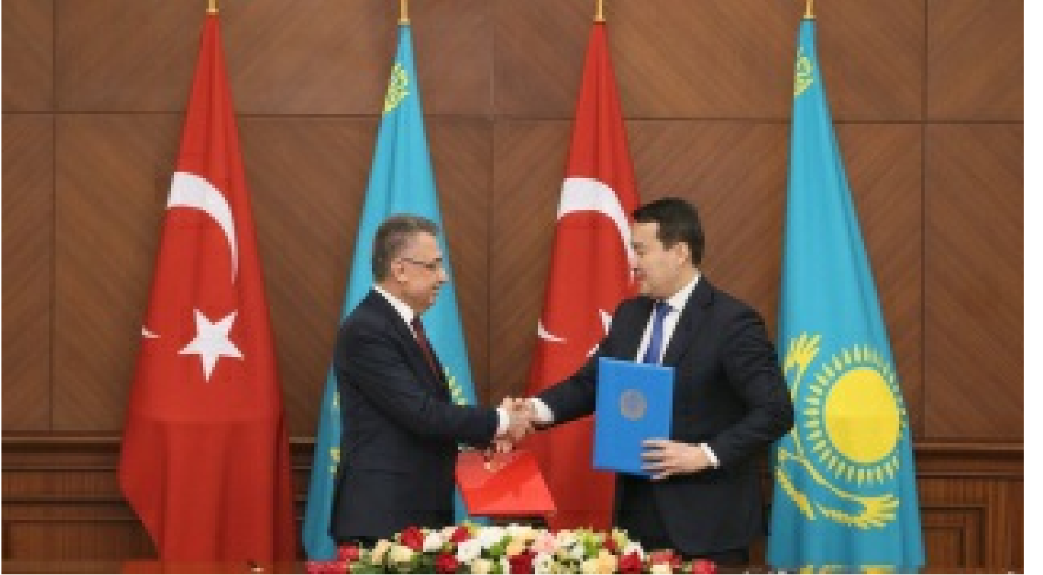
'Köklerimizden güç alarak bölgede istikrarı perinleyeceğiz'