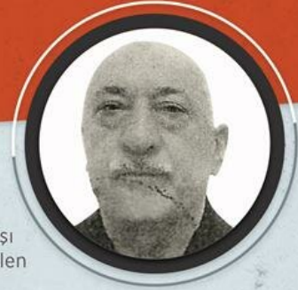
FETÖ elebaşı Fetullah Gülen

FETÖ'nün darbe teşebbüsünde Cumhurbaşkanı Erdoğan'a suikast girişimine ilişkin davada savunmaları alınan sanıkların tutarsız ve birbirini yalanlayan ifadeleri öne çıktı