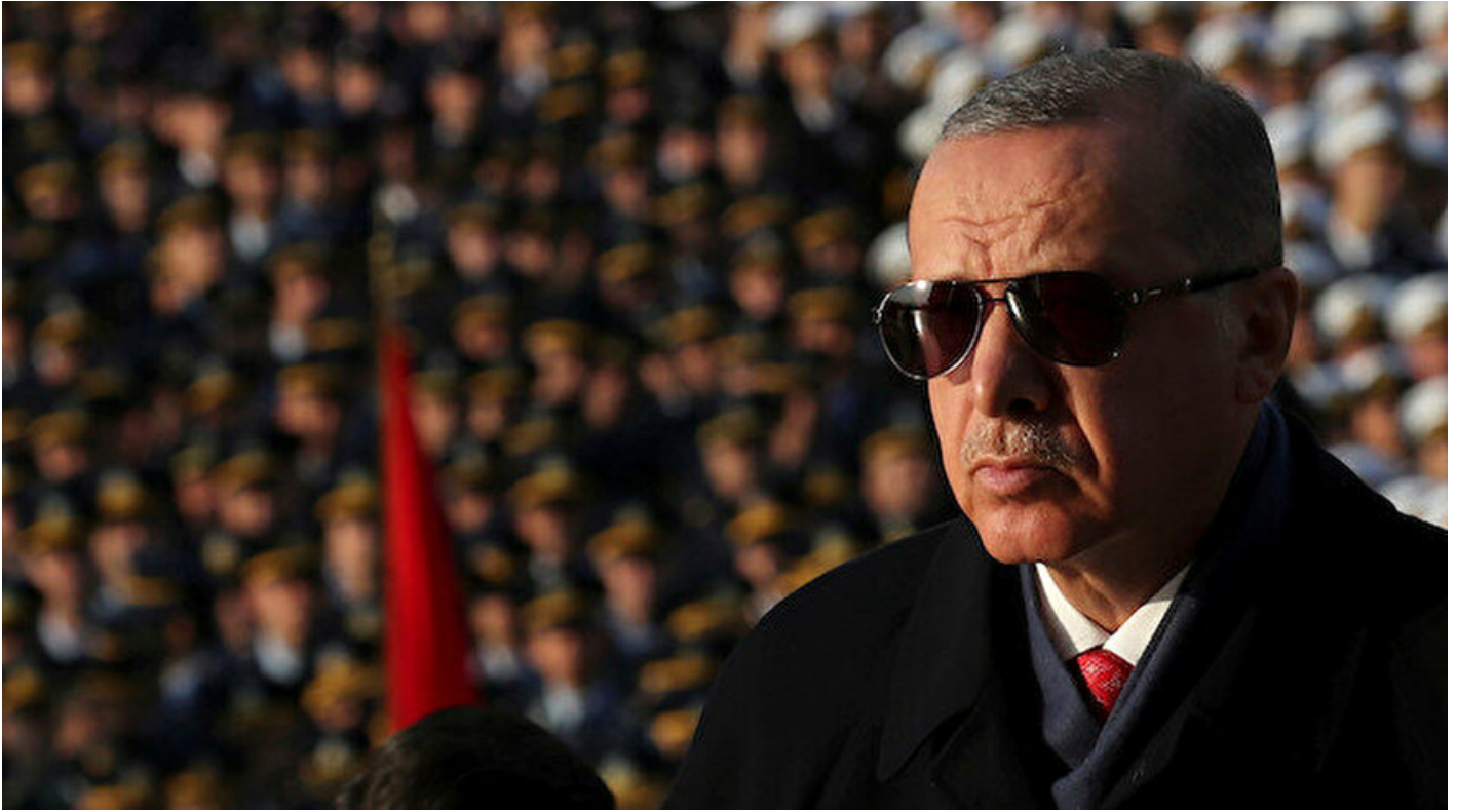
Cumhurbaşkanı Recep Tayyip Erdoğan.