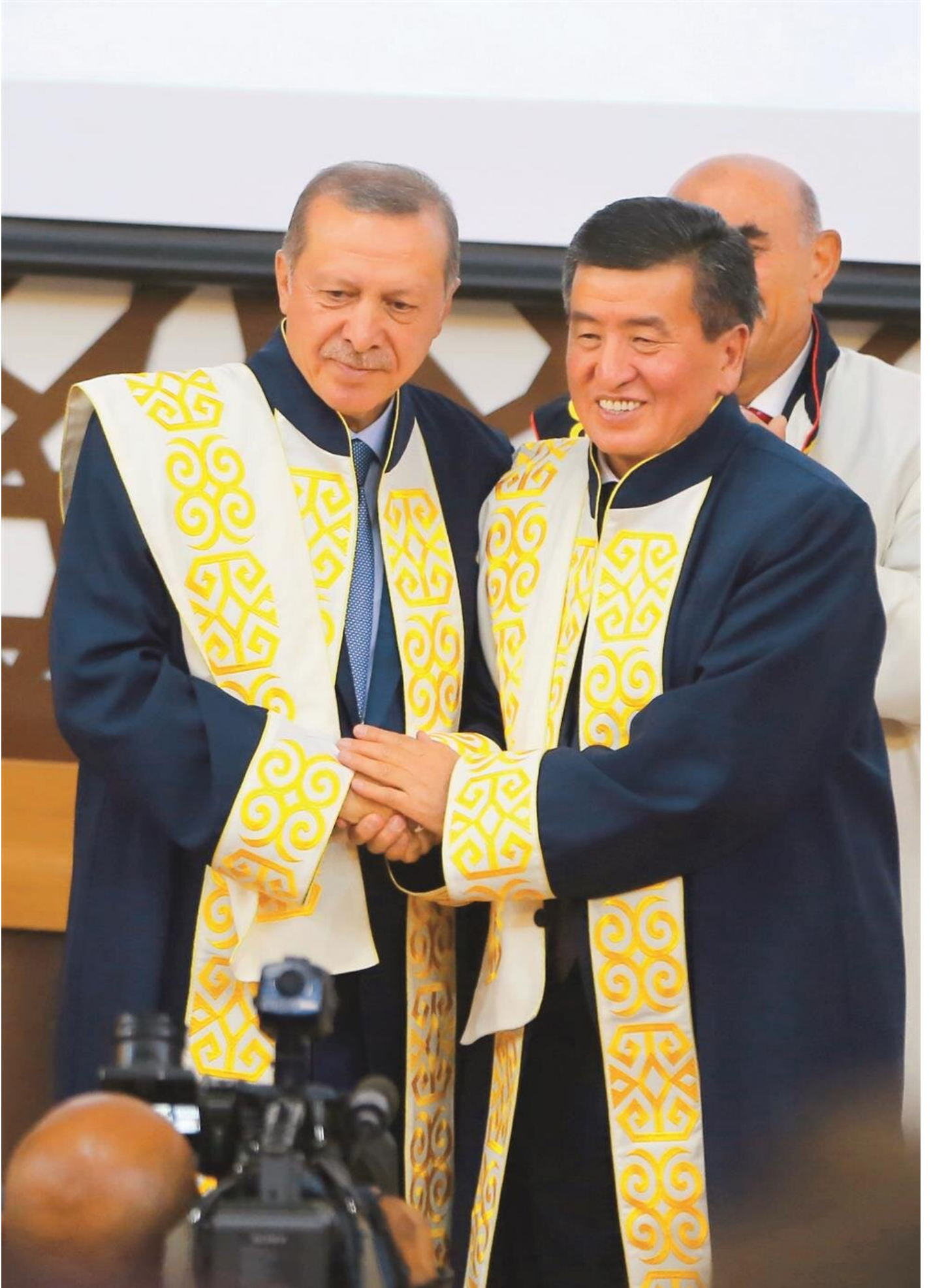
Erdoğan ve Ceenbekov, dualar eşliğinde kurdele kesip, camının açılışını yaptı.